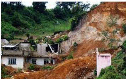
Alunecări de teren

Încercuiți imaginile de mai jos care indică riscurile acoperite de PAD: