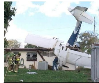
Casă distrusă de căderea unui avion