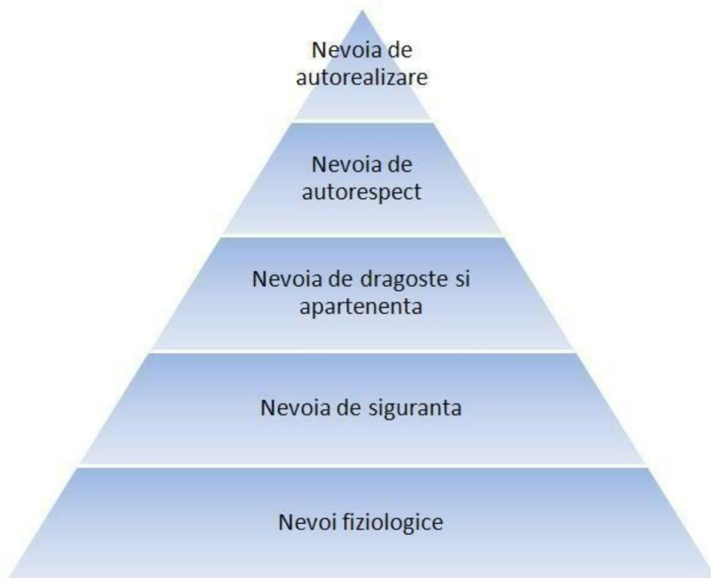
Piramida lui Maslow