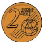
2¢ Two cents