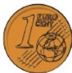
1¢ One cent