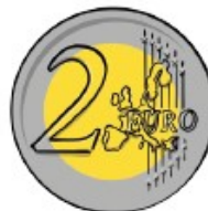
€2 Two euros