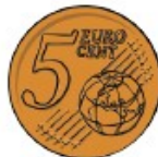
5¢ Five cents