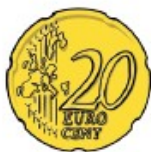
20¢ Twenty cents