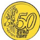
50¢ Fifty cents