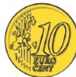
10¢ Ten cents