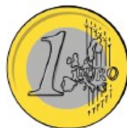
€1 One euro