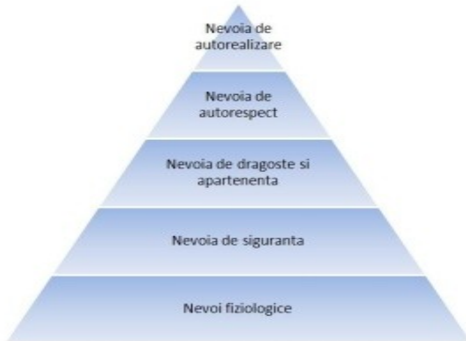
Piramida lui Maslow